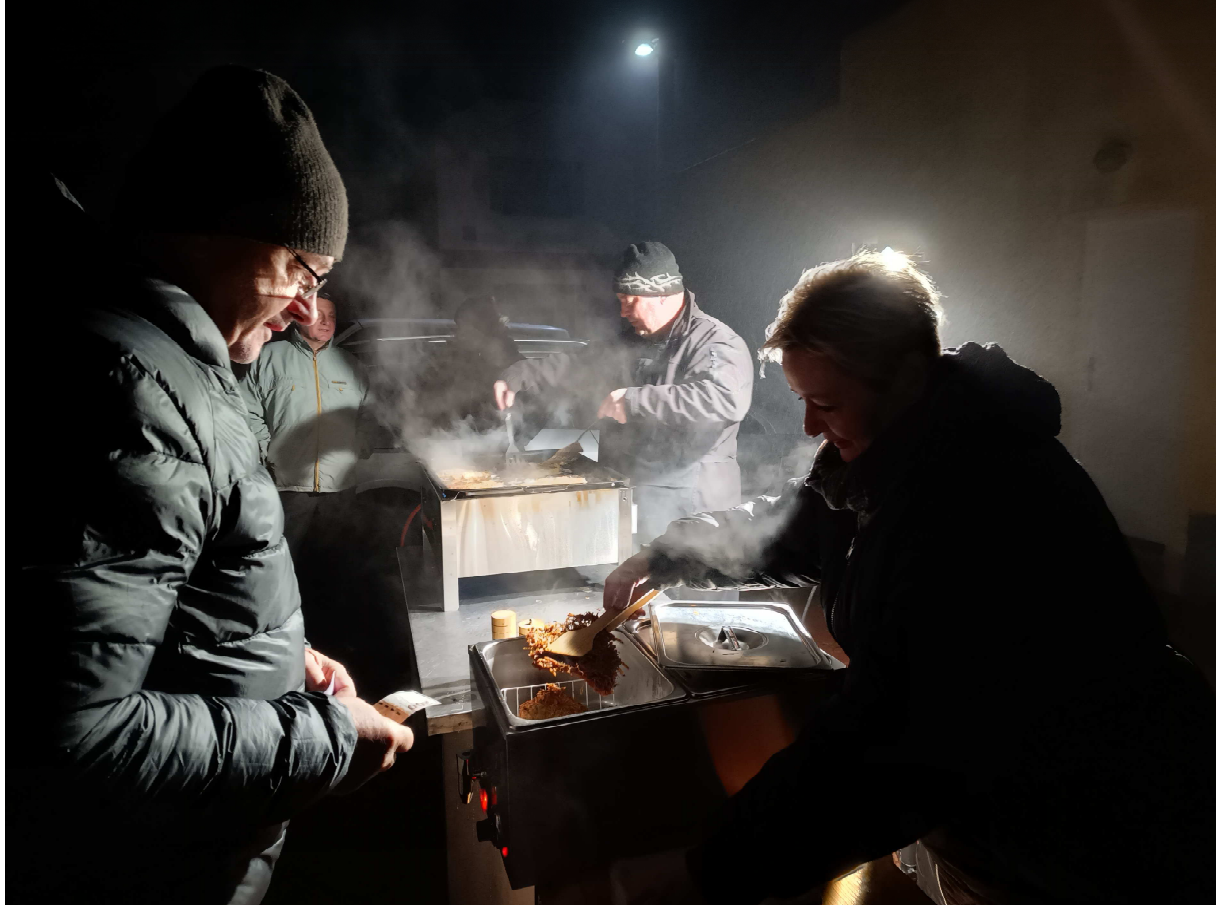
text a foto Jana Syryčanská

První adventní neděle se u nás tradičně rozsvěcuje vánoční strom na točně. Tentokrát to byla neděle 30. listopadu, kdy jsme se po setmění sešli a slavnostně stromeček rozsvítili. Pod nazdobeným stromem jsme si užili vystoupení dětí ze ZŠ Stará Ves a pak také krásné písničky v podání dobrčických zpěvaček pod vedením Daniely Houžvové. Pro děti byl přichystaný na zahřátí čaj, pro dospělé svažené víno a opět výborné bramboráky Zbyňka Stiskala. Děkujeme všem, kdo se na přípravě podíleli.