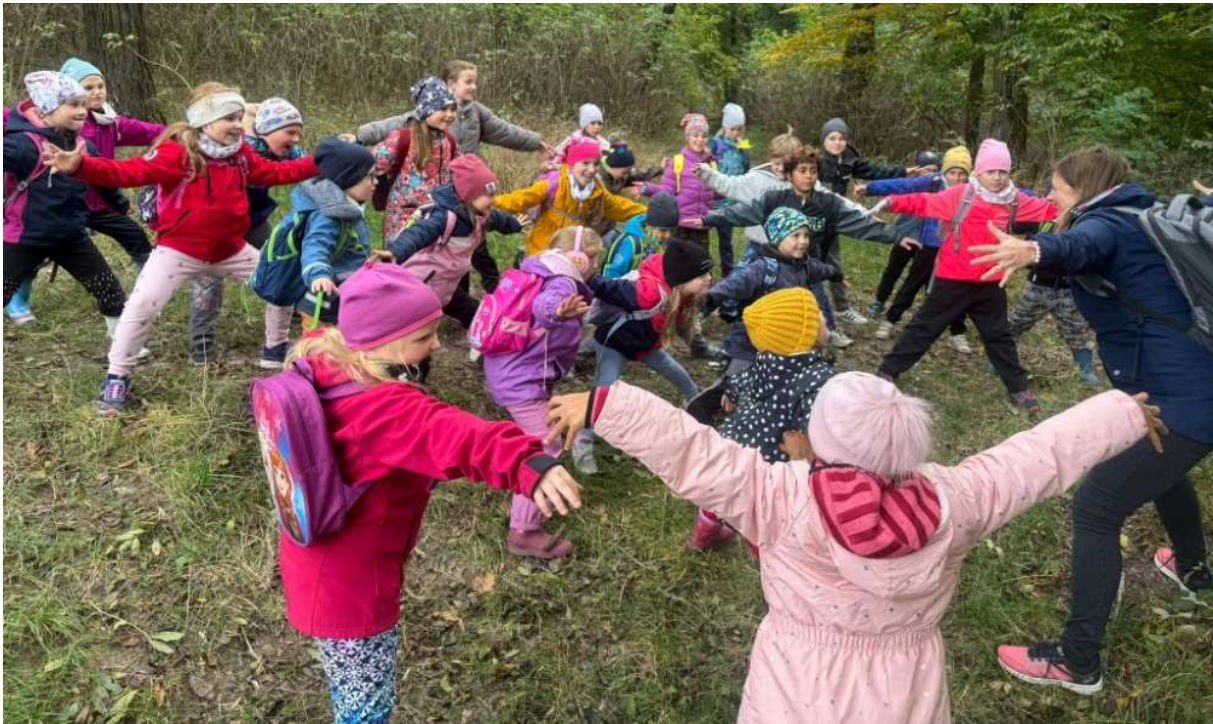
text a foto Kateřina Vansová