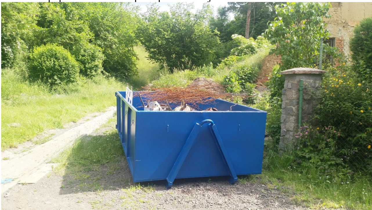
Marek Ostrčil, foto MO

Obec pořídila modrý kontejner na železo. Ten je momentálně umístěn na pozemku obce u domu „Chmelařových“ pod OÚ. Tento kontejner nahradil místo pro odkládání kovů u OÚ. Plechovky i nadále vhazujte do černé označené popelnice, která je umístěna vedle kontejneru. Svoz kovů nově zajišťuje sám OÚ a výtěžek z prodeje železa bude promítnut do kalkulace poplatků za svoz odpadů pro následující rok.