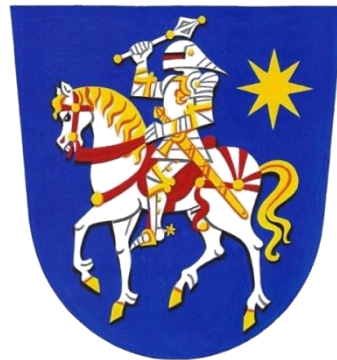
Znak obce Dobřice